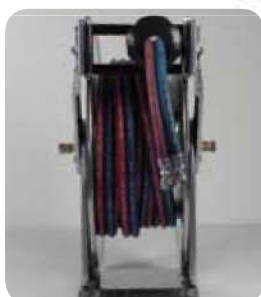
Staffa girevole Swivel bracket